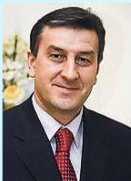
Фаррахов Айрат Закиевич – министр здравоохранения Республики Татарстан